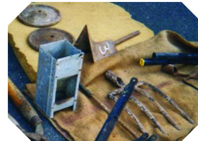
12 mai 2005