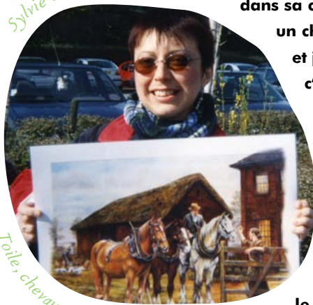
Toile: chevaux de ferme