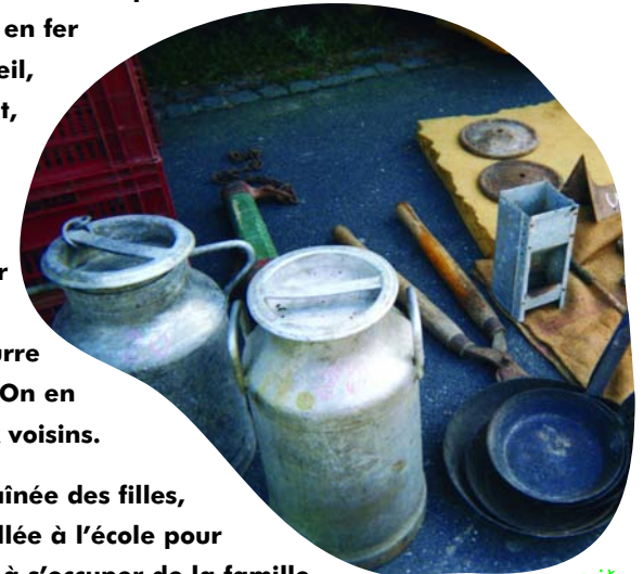
Pots à lait

Il n'était pas en cuivre mais en fer blanc. Tous les jours, au réveil, de bonne heure, on se lavait, on prenait un café et après on s'occupait du lait. Tout devait être prêt avant que le camion ne vienne chercher les bidons. Avec le reste du lait, nous faisons du beurre et un peu de fromage. On en donnait un peu aux voisins.