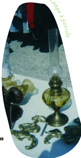
Lampe à pétrole

C'est chez mes frères et sœurs, qui y retournent tous les ans, que je peux voir des objets de là-bas. J'y suis retournée à une époque mais maintenant, ça ne me dit plus rien. Je ne m'en souviens plus très bien. C'est peut-être enfoui au fond de moi ? Je vais de l'avant et je ne retourne pas en arrière. Je me dépouille, je ne m'attache plus.